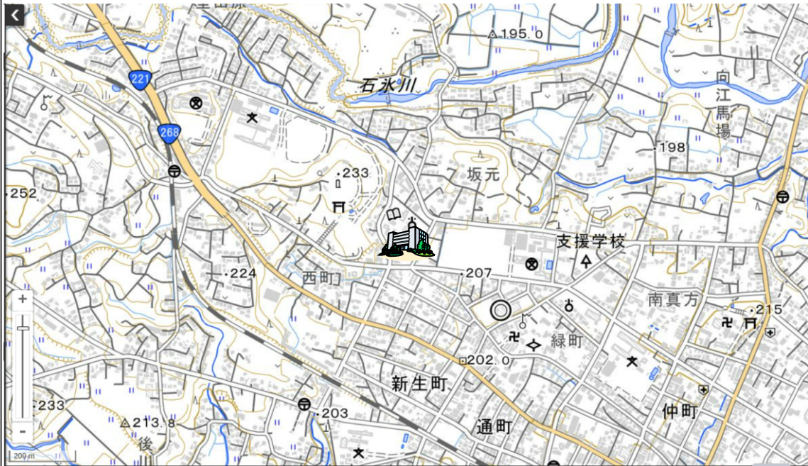
地理院タイルに所在地を追記して掲載