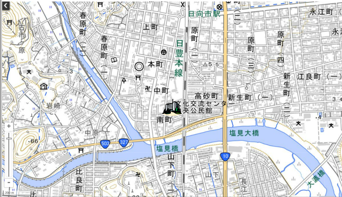
地理院タイルに所在地を追記して掲載