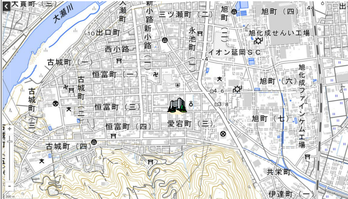
地理院タイルに所在地を追記して掲載