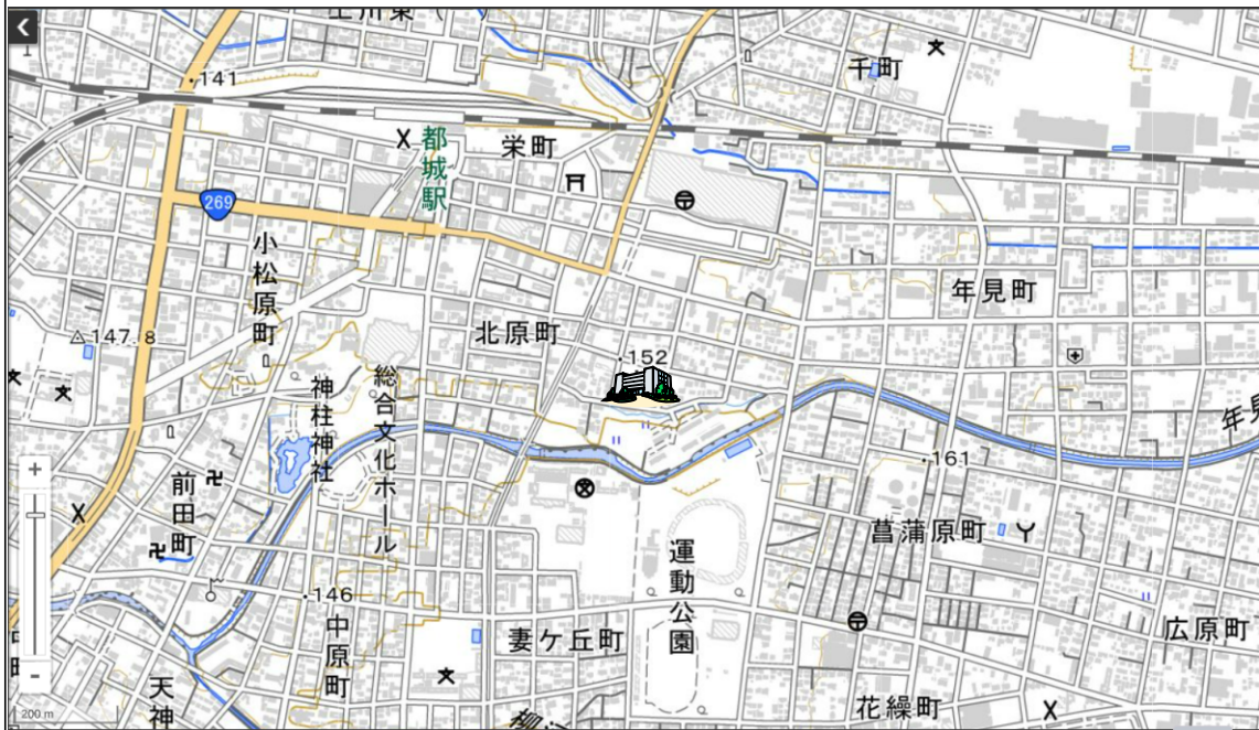
地理院タイルに所在地を追記して掲載