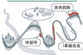
1.5車線の道路整備のイメージ図