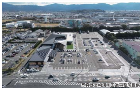
● 道の駅 都城NiQLL(都城市都北町)