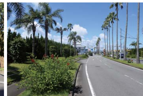
主要地方道 宮崎空港線(宮崎市)サンゴシドウほか