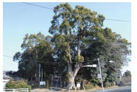
主要地方道 高鍋高岡線(西都市)クスノキ