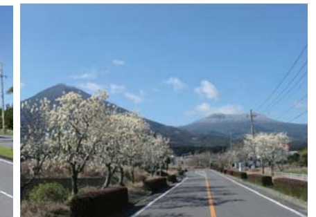
主要地方道 小林えびの高原牧園線(小林市)ハワモクレン