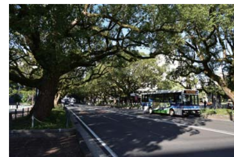
主要地方道 宮崎島之内線(宮崎市)クスノキ