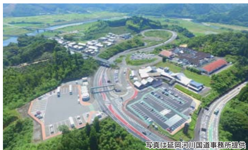
● 道の駅 北川はゆま(延岡市北川町)

「道の駅」において、道路利用者や地域住民が利用しやすい環境整備や観光情報の提供等により、利用者のサービス向上に取り組んでいます。また、災害時の防災拠点としての機能拡充を進めております。