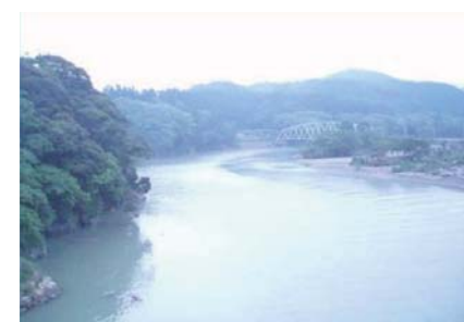
国道10号(日向市)広葉樹林・河川美