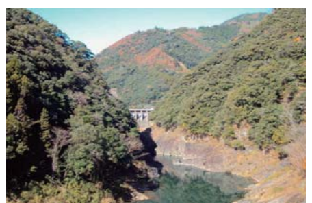
国道327号(諸塚村)溪谷美