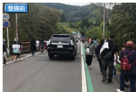
● 下野鹿狩戸線(高千穂町岩戸)

高齢者や障がい者などあらゆる人々が、安全で快適に通行できる歩行空間を提供するため、歩道を整備するとともに、道路のユニバーサルデザイン化を進めております。