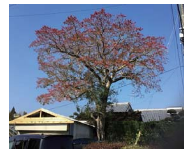
国道10号(日向市)クロガネモチ