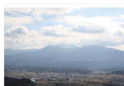
国道221号(えびの市)霧島連山眺望地