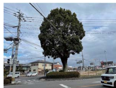
国道221号(小林市)クスノキ