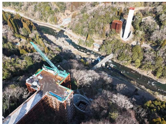
竹田五ヶ瀬線 波帛之瀬工区