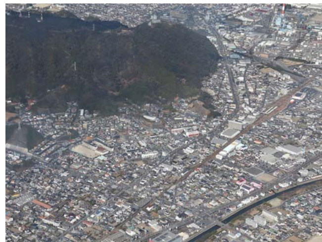
稲葉崎平原線（安賀多通線） 構口・平原工区