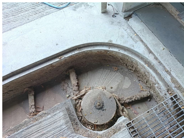
バークリーナー(コーナー部)