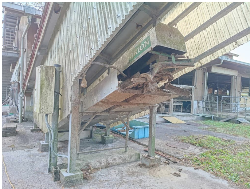
バークリーナー(エレベーター)