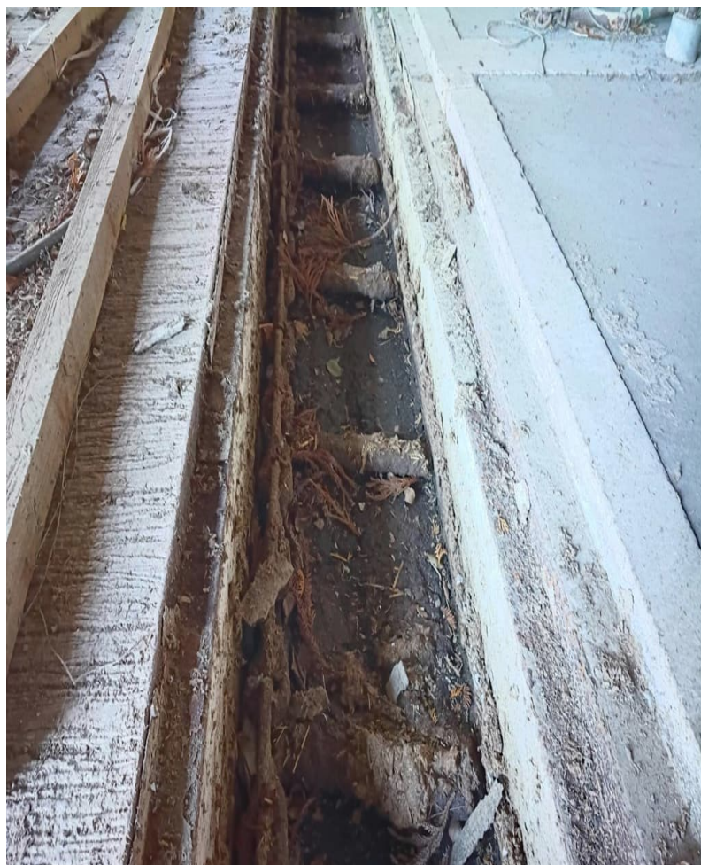
バークリーナー(チェーン)