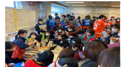
令和6年能登半島地震保健師チームミーティングに参加する宮崎県保健師チーム

* B-Plcは、平時は、地方公共団体の物資の備蓄状況を簡便、迅速に把握し管理。発災時には国・地方公共団体・民間事業者等の間で、物資の調達・輸送等に必要な情報を共有し、迅速・円滑に被災者への物資支援を実現するための物資調達・輸送調整等支援システム