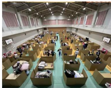
令和6年能登半島地震 避難所