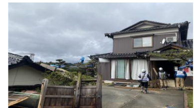
令和6年能登半島地震 宮崎県保健師チームの個別訪問