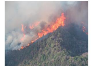
令和7年3月に岡山県岡山市で発生した林野火災の様子

②地上からの放水とヘリコプターによる空中消火との連携及び広域的応援体制による消火活動の強化を記載