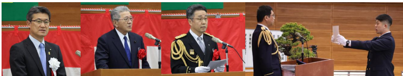
河野 俊嗣 知事