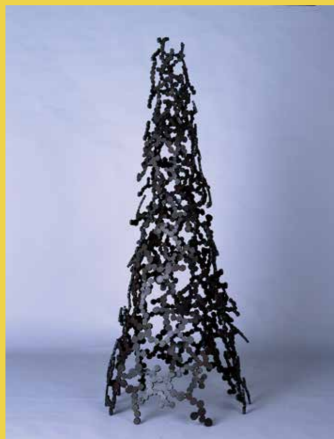
青木野枝「ふりそそぐもの-9」