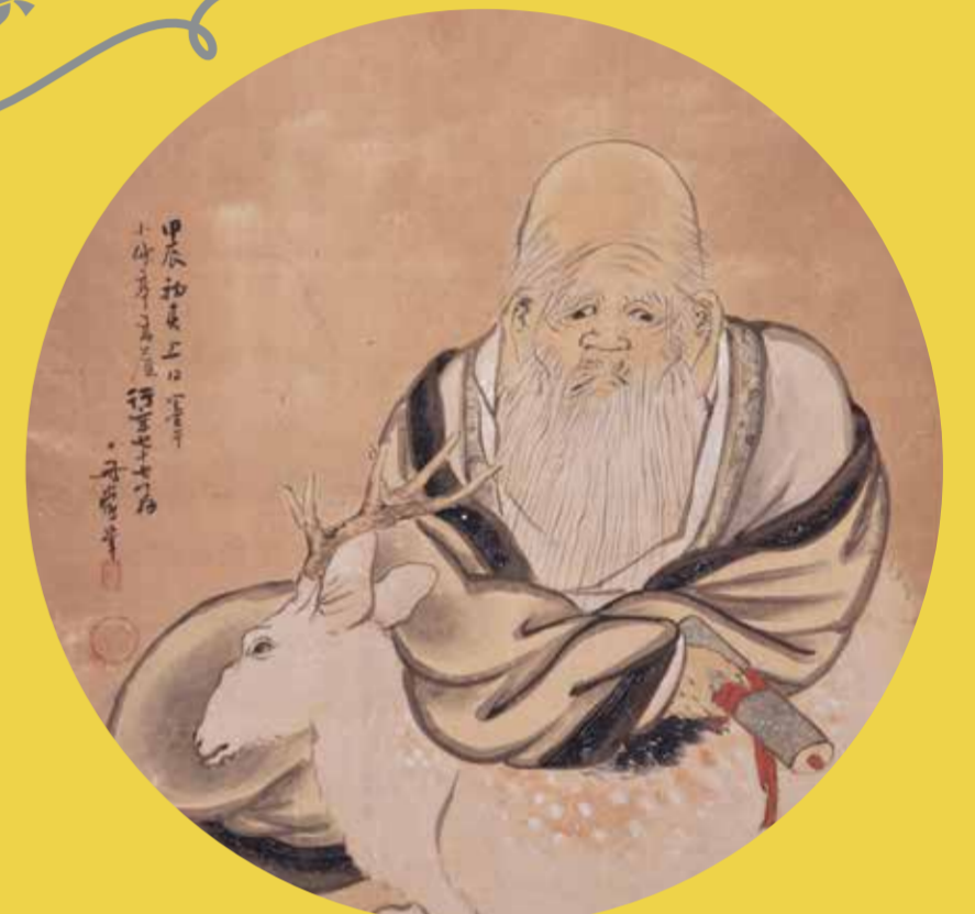
図師舟堂「寿老人」(部分)