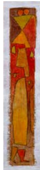
パウル・クレー 「歩く女」

対話や体験をしながら楽しく 作品を鑑賞します 日時：8月22日(土)、 9月12日(土) いずれも 14:00 ~ 14:30 対象：中学生以上 ※申込不要