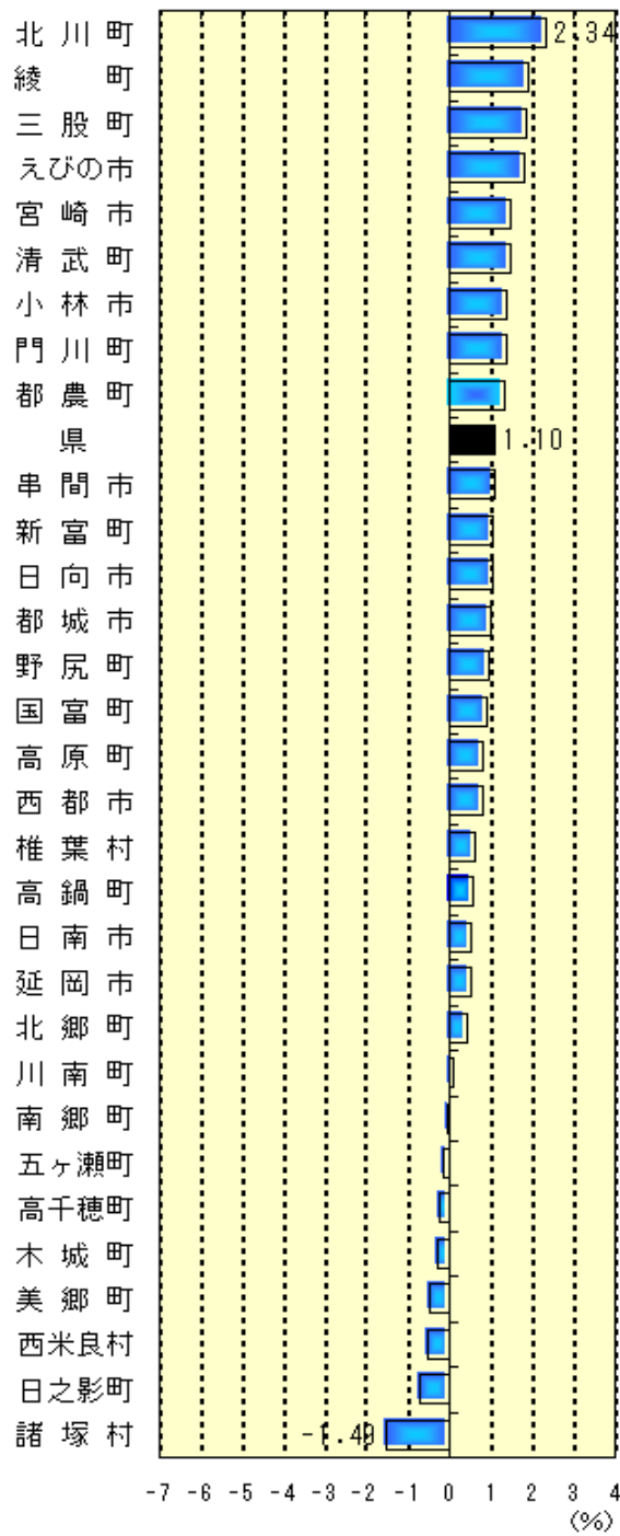
市町村別世帯増減率