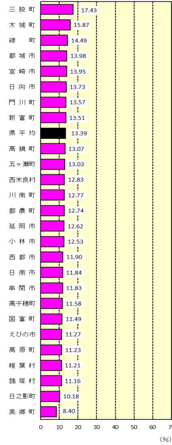
年少人口割合 (0~14歳) (令和元年10月1日現在)