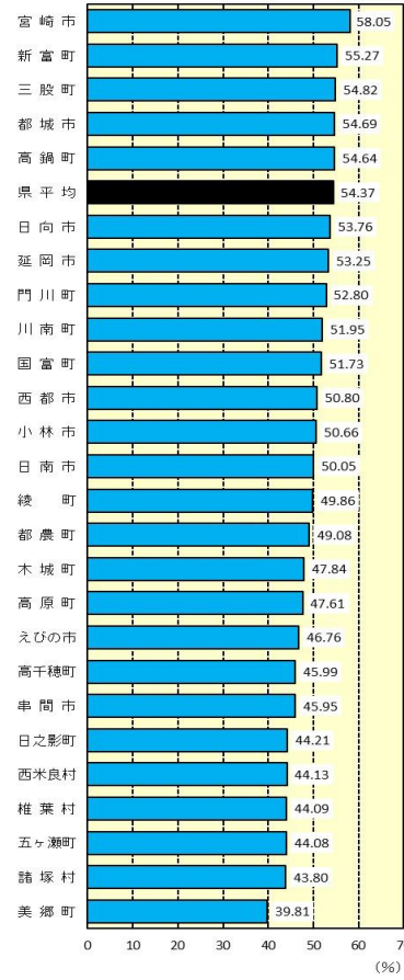
生産年齢人口割合 (15~64歳) (令和元年10月1日現在)