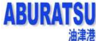
■油津港からの定期航路ネットワーク（平成27年3月現在）

宮崎港は南九州におけるフェリーやRORO船などの内貿複合一貫輸送の中心的役割を担う港です。関西圏との定期航路が開設され、南九州の玄関口としての役割を果たしています。