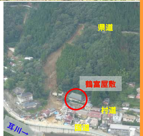
平成17年9月発生 of 『土石流』