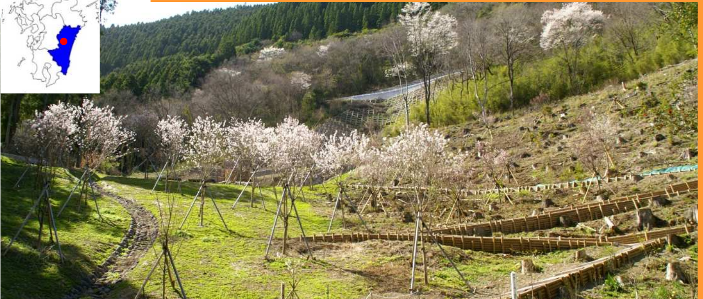
宮崎県東臼杵郡椎葉村『上椎葉谷2川』