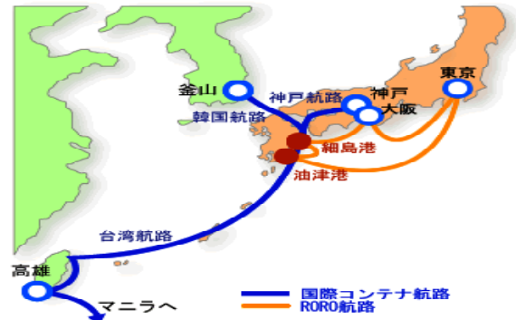
■細島港からの定期航路ネットワーク（平成18年8月現在）

平成5年に韓国とのコンテナ定期航路が開設され、細島港は東九州地域の流通拠点として機能を拡充させつつあります。以来、ネットワークは拡大し、現在では神戸、釜山、高雄を経由して全世界約30ヶ国と交易を進めています。