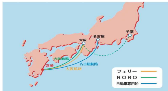
■宮崎港からの定期航路ネットワーク（平成26年3月現在）