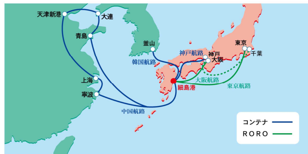
■細島港からの定期航路ネットワーク（平成26年3月現在）