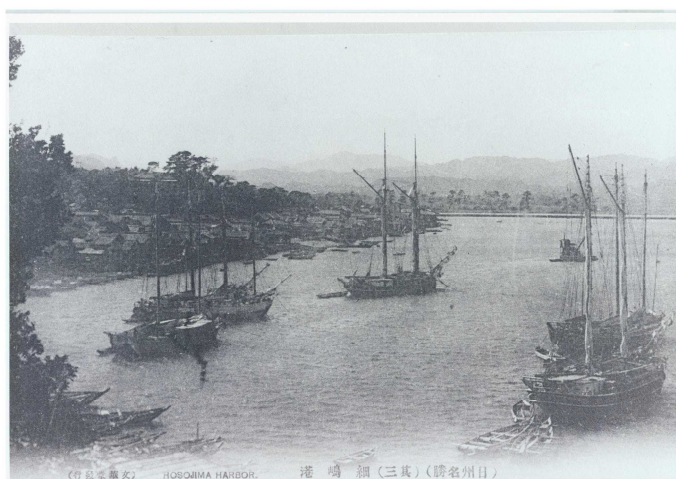
明治10年代頃の細島港（商業港）