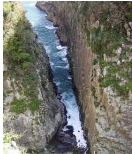
日向岬の馬ヶ背 (日本最大級の柱状節理)

昭和50年6月に国指定天然記念物 全長24cmで黒潮及び対馬海流の流れる暖かい海域に生息し、生息数は全国で5000~6000羽と推測され、そのうち門川町枇榔島は約3000羽で最大の生息地とされています。