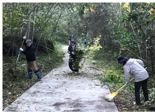
(草刈り作業の様子)