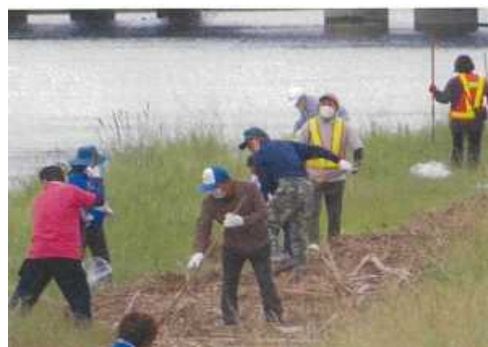
(門川町向ヶ浜 (約100人))