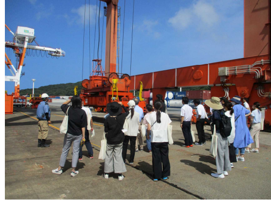
(国際コンテナターミナル見学会)