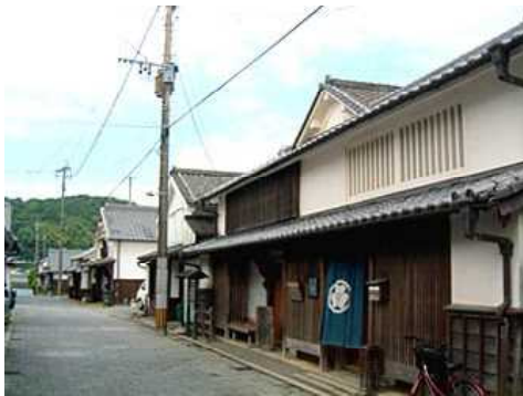
重要伝統的建造物群

明治の初期には美々津に県庁が置かれたことからその賑わいがわかると思われます。当時を偲ばせる建物が重要伝統的建造物群保存地区に指定されています。