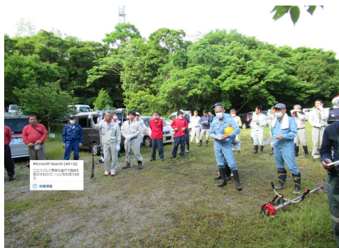
(草刈り作業開始前の様子)

牧島山避難所にもつながる牧島山尾根山道並びに白浜川旧里道の草刈り活動に北部港湾事務所も参加して、避難所への通路等の環境美化を行っています。