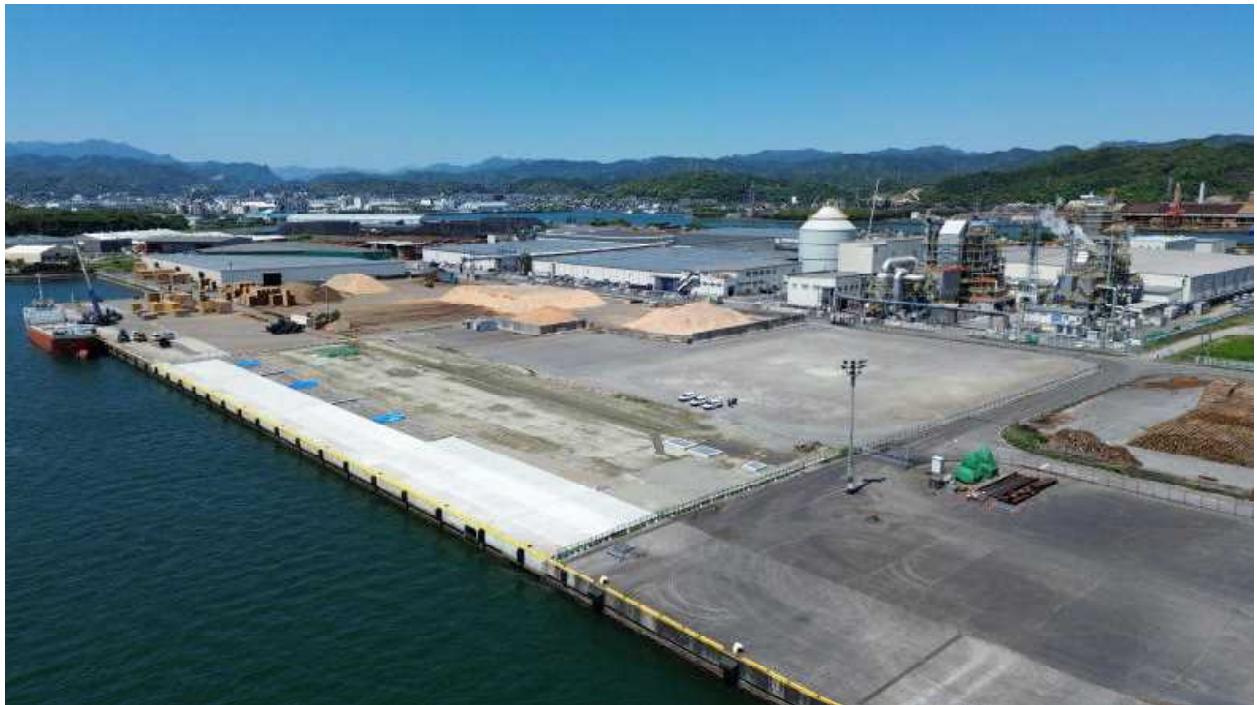
細島港 16号岸壁施工状況（令和6年5月撮影）