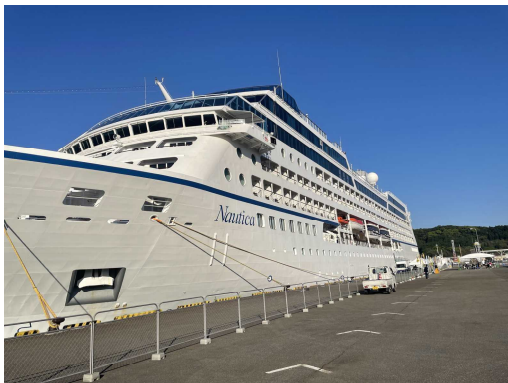
(令和4年度初入港 外航クルーズ客船NAUTICA)

県北地区観光の魅力と細島港の優位性をいかしたクルーズ客船の誘致に対応するため、クルーズ船受入協議会等の関係機関と連携して、円滑に受け入れを行っています。