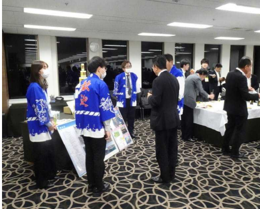
(情報交換会（東京会場）)