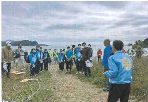
(門川町向ヶ浜 (約150人))

海岸等における草刈りや清掃等の美化活動に取り組む団体及び個人に対し、活動に必要な資材の提供などの支援を行っています。