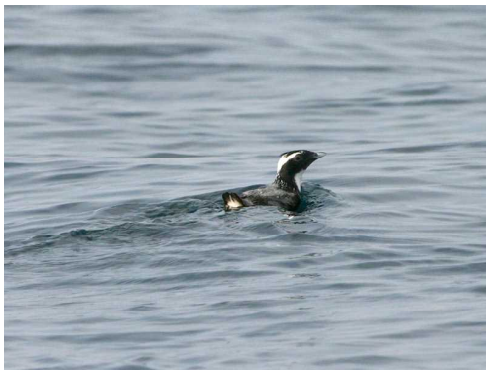
カムリウミスズメ

沿岸海域には高島、島浦島、枇榔島、乙島をはじめ多くの島・瀬・礁があり、五ヶ瀬川、耳川、沖田川、五十鈴川等の河川から多くの淡水が流れ込み、沖合を黒潮が北上し豊後水道から南下する沿岸水との間で複雑な海況を呈してイワシ・アジ・サバの好漁場となっています。また、その沖合海域はカツオ・マグロの漁場が形成されています。