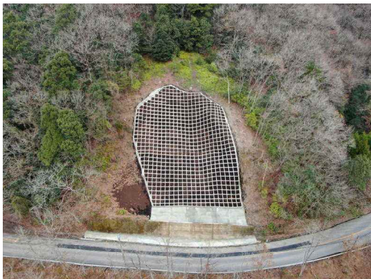
国道446号鎌柄工区（日向市東郷町）

令和4年9月の台風14号と令和5年8月の台風6号により管内の国県道においても道路決壊や法面崩壊が発生した。応急復旧工事の速やかな実施や、国の権限代行事業による仮橋設置等の取組を行うことで、通行止め箇所の早期解消や崩壊箇所の速やかな復旧に取り組んでいる。