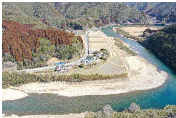
上井野地区~笠原地区 (河道掘削)

現在、流下能力が低い区間 (上井野~笠原、小松地区、大池地区) において河道掘削等を集中的に実施し、早期の治水安全度の向上に取り組んでいます。