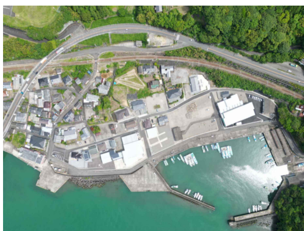
幸協地区 (護岸工、嵩上げ工)

今年度、幸協地区の土地利用一体型水防災事業の完成を図るとともに、福瀬地区の橋梁架替や白浜地区の築堤の調査・設計を引き続き推進していきます。また美郷町西郷和田地区については、土地利用一体型水防災事業に着手し、道路事業と連携しながら、浸水・冠水対策に取り組んでいきます。