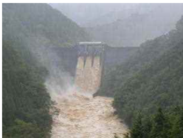
放流時の渡川ダム