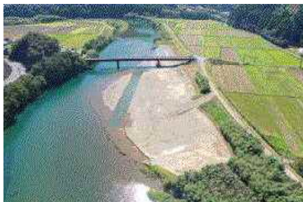
大池地区 (河道掘削)