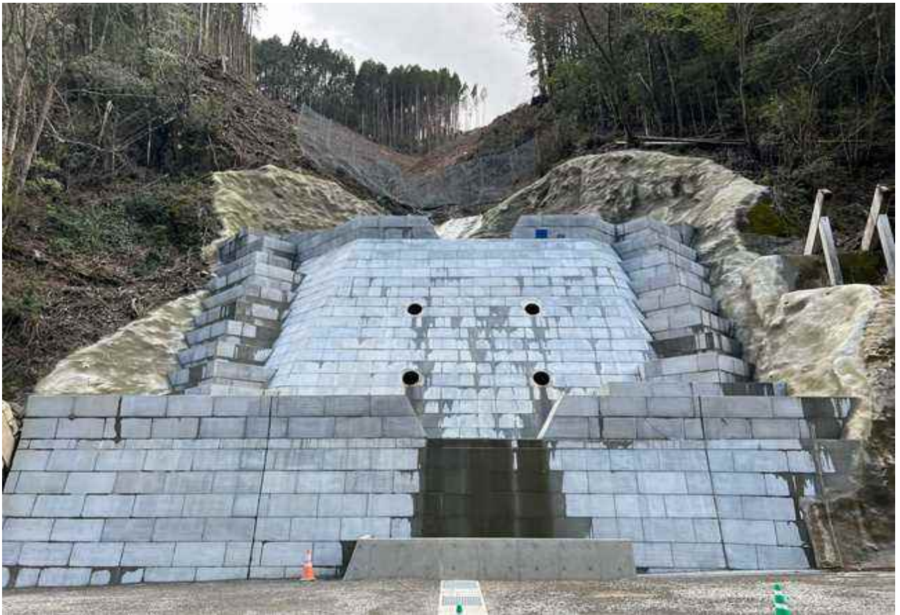
鹿野遊谷川(椎葉村下福良) 砂防えん堤