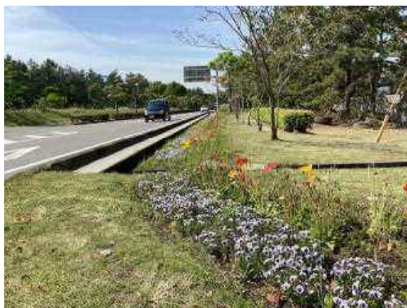
県民との協働による花の植栽 【県道日知屋財光寺線】