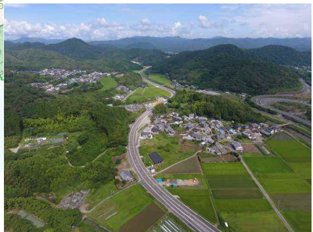
国道327号 永田バイパス (日向市秋留～大斉区間) (令和4年7月開通)