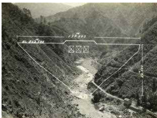
ダム建設前の渡川 (S27.3)