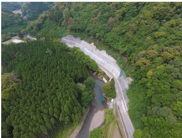
八重原延岡線 阿仙原2工区

国道へのアクセスや指定避難所への避難ルート、当該エリアにおける幹線道路的機能等、それぞれの地域で求められる道路の機能に応じて、1.5車線の道路整備手法を交えながら道路改良を進めている。