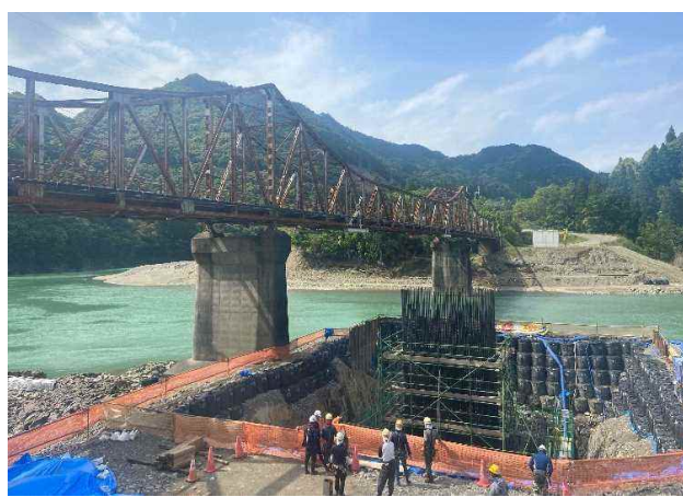
福瀬大橋 (橋梁架替)