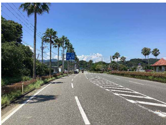
沿道修景植栽地区の再整備 【県道日知屋財光寺線】

平成29年4月に施行された「美しい宮崎づくり推進条例」に基づき、県土の美化を推進するため、沿道修景美化推進路線におけるリニューアル整備や沿道修景植栽地区の適正な維持管理、国道327号における眺望回復の取り組みのほか、県民との協働による花木植栽を行っている。