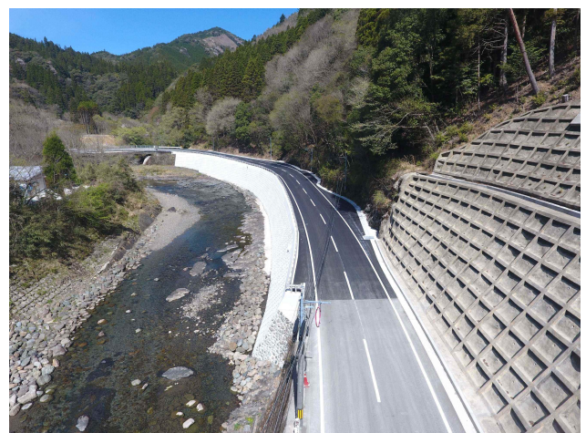
西都南郷線 上渡川工区