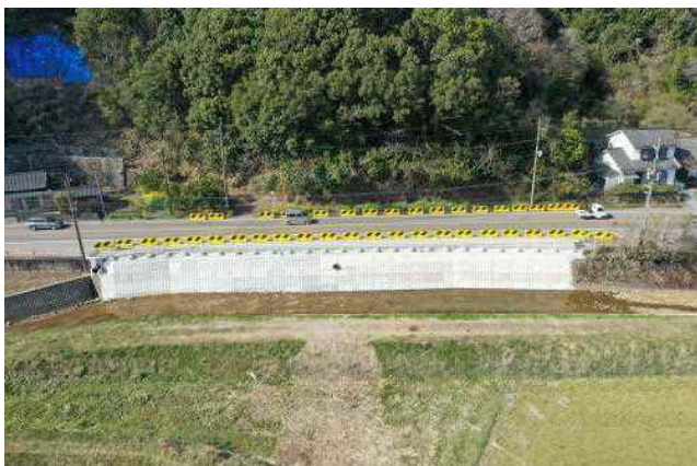
国道327号 日向市 永田工区

緊急輸送道路等の防災強化や、安全かつ円滑な交通の確保を図るため、道路防災点検結果や特定土工点検に基づき、落石の危険がある箇所や擁壁の損傷箇所において防災対策事業を実施している。また、老朽化が進行している橋梁・トンネルの維持補修事業を実施し、災害に強い道路ネットワークの整備充実を図っている。