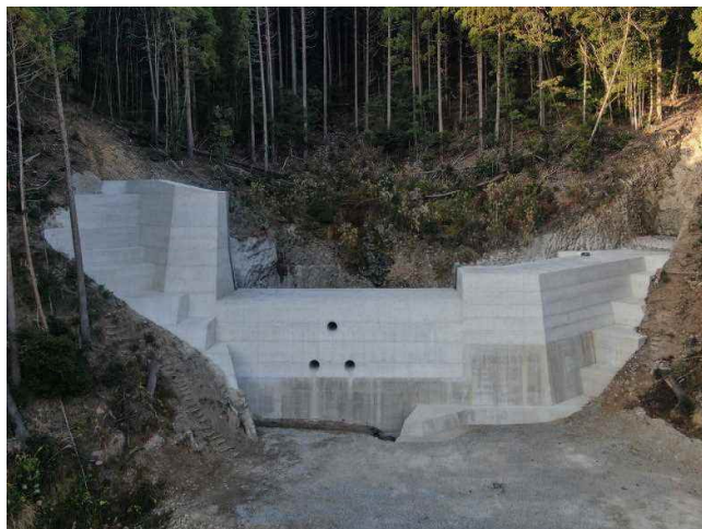
中田谷川 1 令和 6 年 3 月 施工中