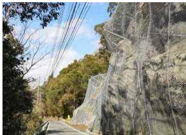
国道388号 門川町 前平工区