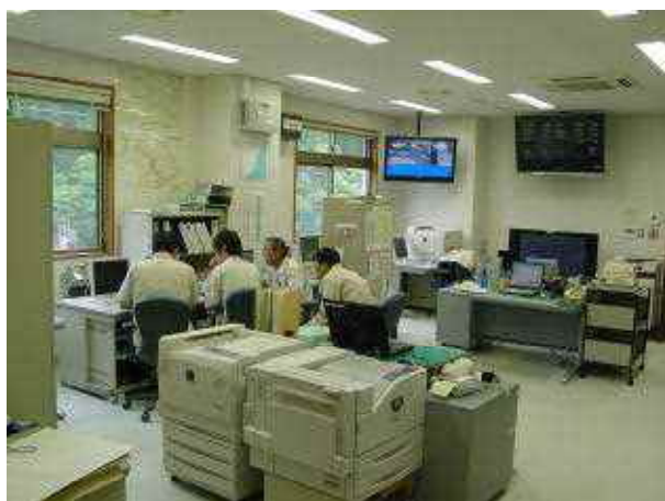
ダム管理の様子(管理事務所内)