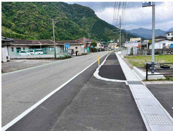
国道327号 日向市東郷町 小野田2工区

歩行者の安全で快適な空間を確保するために、国道327号と国道388号において歩道の整備に取り組んでいる。