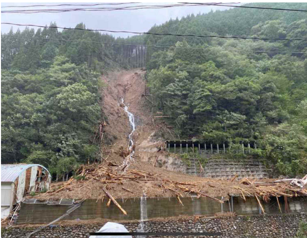
椎葉村 鹿野遊谷川 被災状況(R2.9.7)

令和2年9月の台風10号により椎葉村鹿野遊地区で発生した土砂災害について、災害関連事業（R2採択）で設置する砂防堰堤とあわせて斜面对策を実施し、今後の土砂災害を防止します。