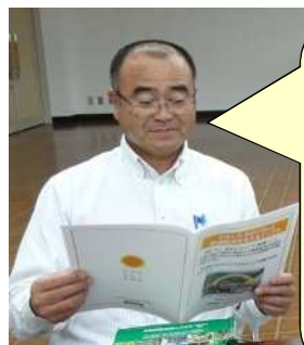
JAはまゆう 中田営農部長

スイートピーの輸送手段を空輸から陸送に転換することを検討している。品質を確保するために東九州道の全線開通に期待している。