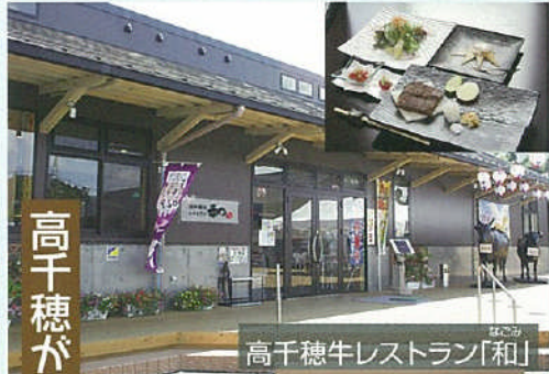
高千穂牛レストラン「和」