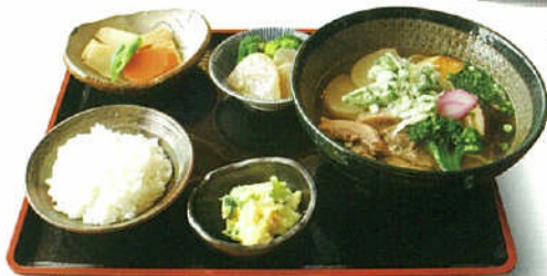
▼「道の駅」酒谷名物 「棚田そばセット」