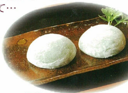
▲「道の駅」酒谷名物 「草だんご」