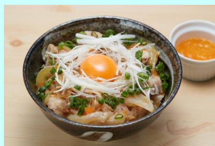
◀優勝したレシピ（宮崎 ブランドポークときん かんのなにわ丼）