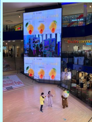
▲宮崎県観光PRステージ