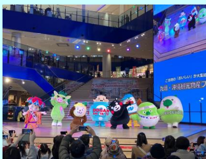
▲ご当地キャラステージ