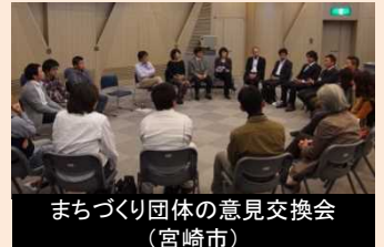
団体間の交流機会の創出