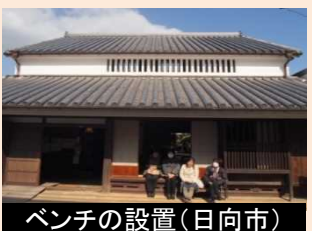
ベンチの設置(日向市)