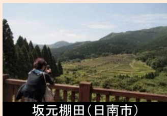
坂元棚田(日南市) 展望所の設置