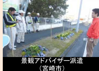
専門家による助言指導