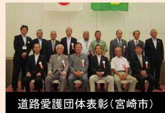
顕著な功績があったものの表彰