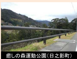
癒しの森運動公園(日之影町)