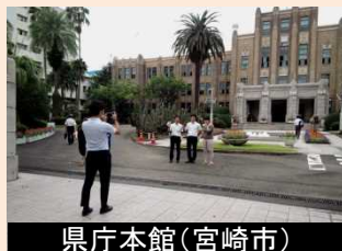
県庁本館(宮崎市) 視点場の整備