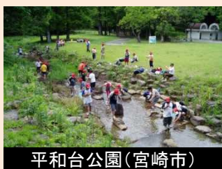
平和台公園(宮崎市)