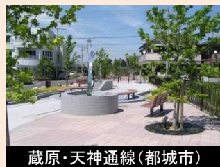
蔵原・天神通線(都城市)