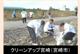
クリーンアップ宮崎(宮崎市)