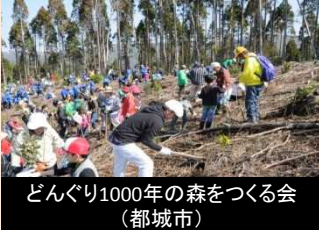
どんぐり1000年の森をつくる会 (都城市)