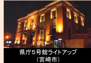
美しい宮崎づくりに取り組む団体への情報提供