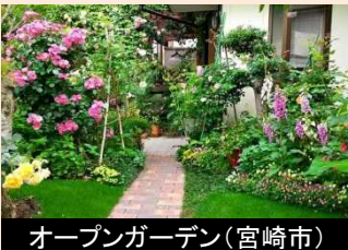
オープンガーデン(宮崎市)