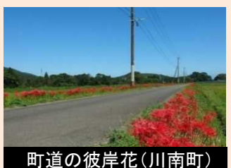
町道の彼岸花(川南町) 沿道景観の保全又は創出