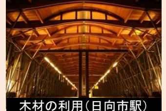
木材の利用(日向市駅)