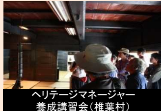
専門的知識を持つ人材の育成