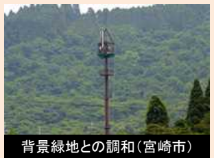
背景緑地との調和(宮崎市)