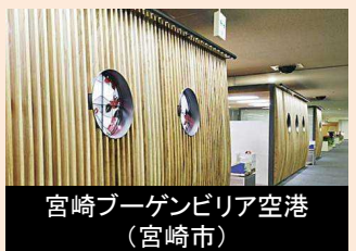
宮崎ブーゲンビリア空港 (宮崎市)