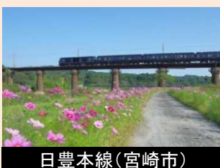
日豊本線(宮崎市) 沿線景観の保全又は創出