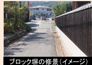
ブロック塀の修景(イメージ)