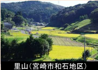
里山(宮崎市和石地区)