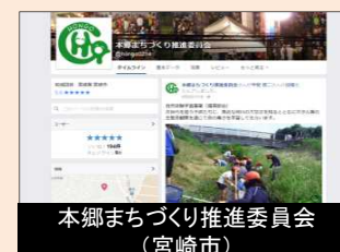
本郷まちづくり推進委員会 (宮崎市)