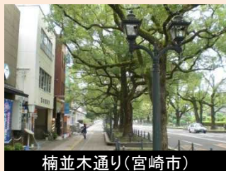
楠並木通り(宮崎市)