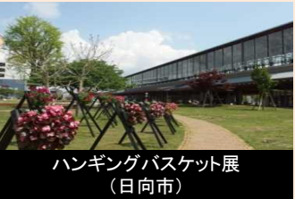
美しい宮崎づくりに取り組む団体への情報提供