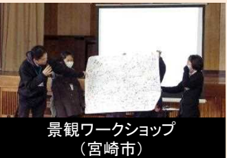
専門的な技術を生かした人材育成及び県民等の活動支援