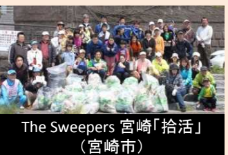
活動への参加を促進するための推進強化月間