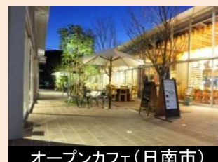
オープンカフェ(日南市) 交流の場づくり