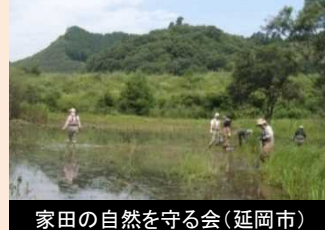
家田の自然を守る会(延岡市)