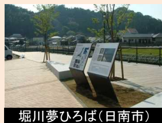
堀川夢ひろば(日南市)