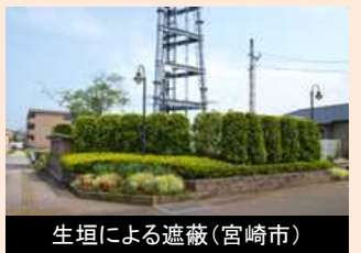
生垣による遮蔽(宮崎市)