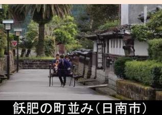
飢肥の町並み(日南市)