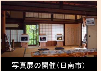
写真展の開催(日南市)