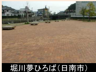
堀川夢ひろば(日南市)