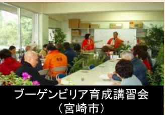
専門的な技術を生かした人材育成及び県民等の活動支援