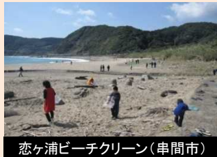
恋ヶ浦ビーチクリーン(串間市)