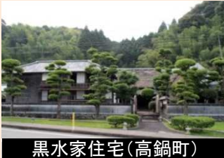
黒水家住宅(高鍋町)