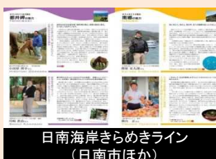
日南海岸きらめきライン (日南市ほか)