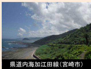
県道内海加江田線(宮崎市)