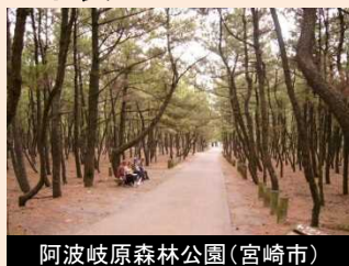
阿波岐原森林公園(宮崎市)