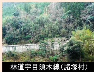
林道宇目須木線(諸塚村)