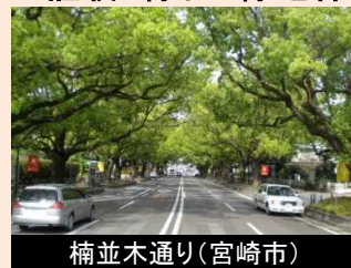
楠並木通り(宮崎市)