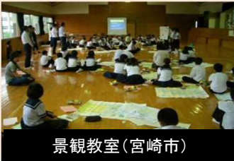
学習の機会の提供