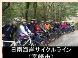
日南海岸サイクルライン (宮崎市)