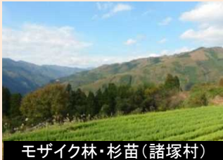
モザイク林・杉苗(諸塚村)