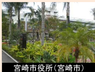
宮崎市役所(宮崎市)