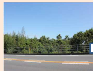
沿道周辺における樹木の伐採