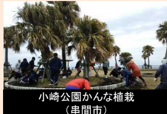
美しい宮崎づくりに取り組む団体への情報提供