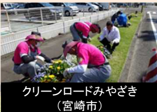
活動への参加を促進するための推進強化月間