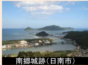
南郷城跡(日南市) 視点場周辺の樹木の伐採