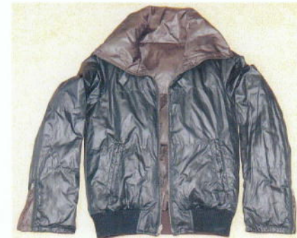
黒色ジャンパーのタグ