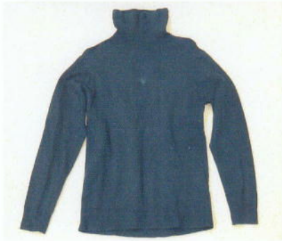
黒色タートルネックセーター (COMME CA ISM Mサイズ)