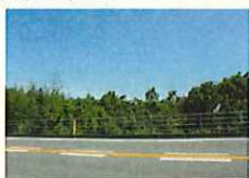
沿道景観の保全・創出