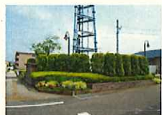
生け垣や塗装による景観阻害要因の改善