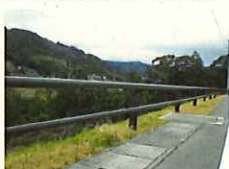
景観に配慮した防護柵