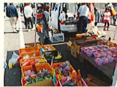
県産品の消費拡大