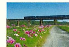
沿線景観の保全・創出