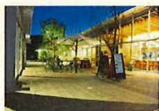
賑わいの空間づくり