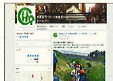
積極的な情報発信