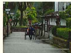
歴史的景観の保全