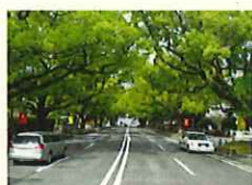
街路樹の適正な管理