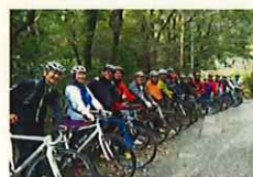
体験・交流機会の提供