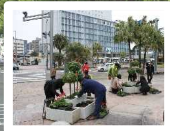
ビックイベントに向けたおもてなしの環境づくり