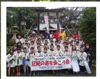
歴史的・文化的景観、 潤いと安らぎのあるまちなみ景観の保全及び創出