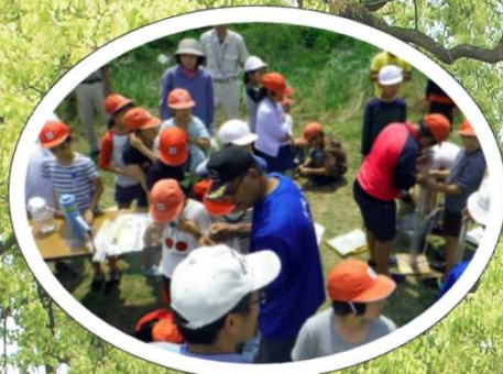
こども達の体験学習