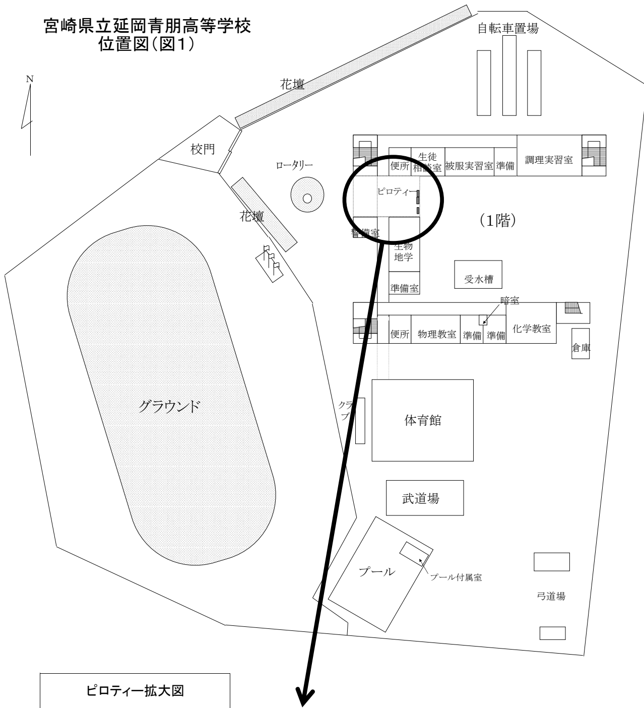
ピロティー拡大図