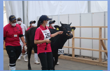
会場で一番立派な立ち姿

第12回全国和牛能力共進会 優等賞2席獲得 発表テーマ「地域で育む和牛道～牛との絆は宝物～」