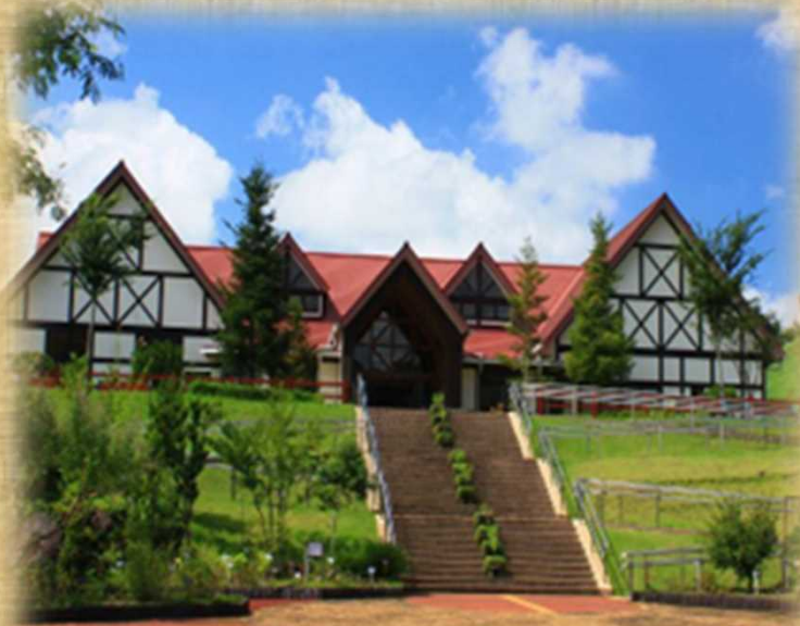
センター事務研究棟

主な取り組みは、近年の健康志向や生活様式の多様化の中で注目されてきた薬草、ハーブ等について、新たな地域特産物として定着できるよう研究を進めています。