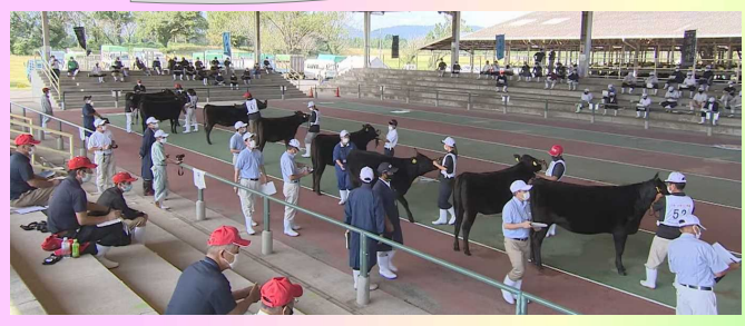
↑第12回 全国和牛能力共進会宮崎県出品対策共進会(プレ全共) 令和3年10月7日