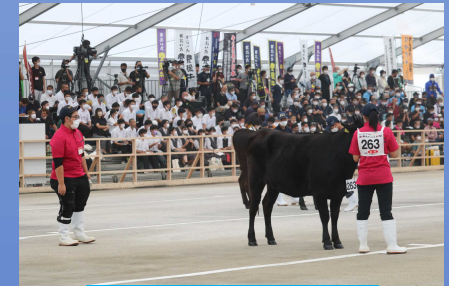
会場で一番立派な立ち姿