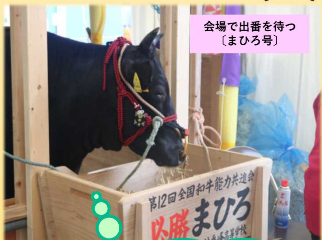
会場に出番を待つ〔まひろ号〕