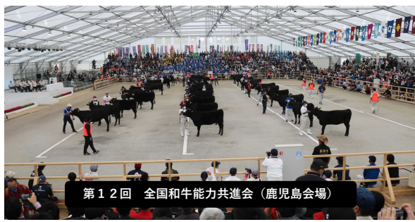
第12回 全国和牛能力共進会(鹿児島会場)