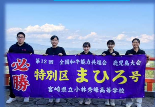
秀峰高より贈られた横断幕とともに

畜産分野を選択した生徒は、高原農場で飼育される21頭の“秀峰牛”の飼育などを実践します。