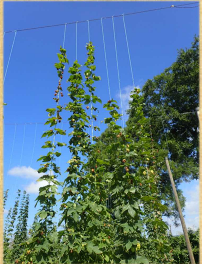
ホップの栽培状況

また、これらの作物を食と健康に活かすために利用法等の情報を提供する取り組みも同時に行っています。