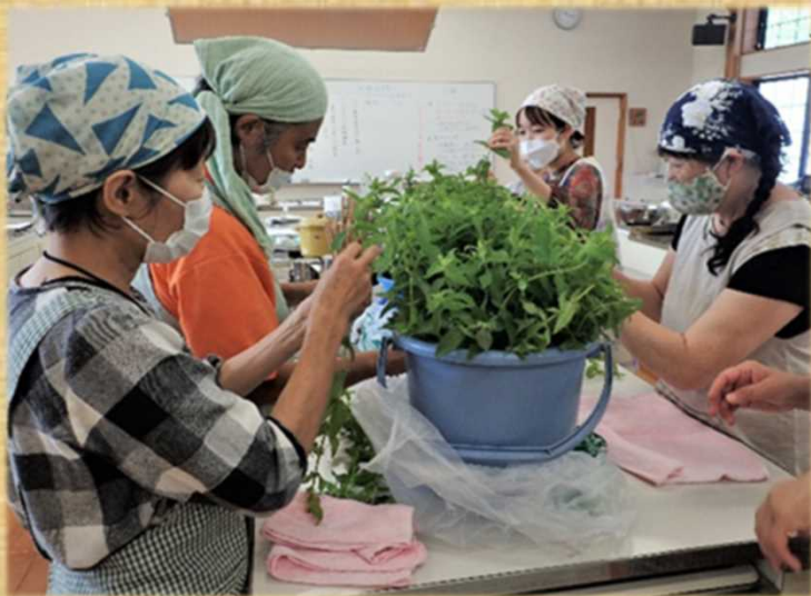
ハーブ講座の様子

総合農業試験場 薬草・地域作物センター 〒886-0212 小林市野尻町東麓2581-88 TEL (0984) 21-6061