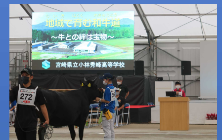
取り組み発表の様子