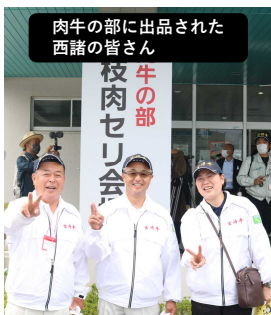
肉牛の部に出品された西諸の皆さん