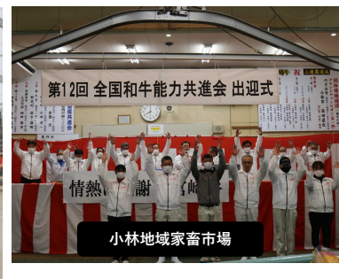
小林地域家畜市場