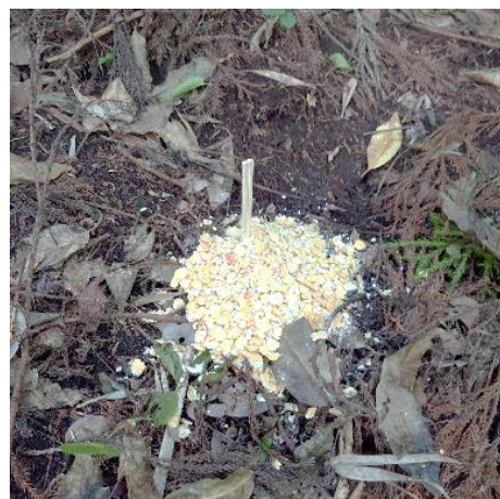
↑ワクチン散布後の様子