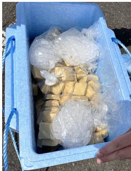
↑散布したワクチン