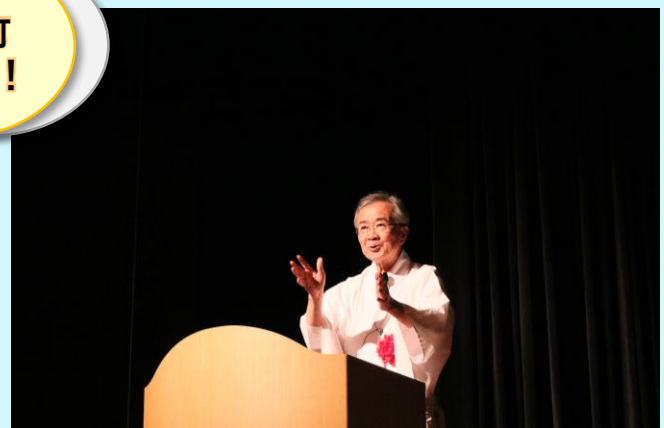
宮崎神宮 本部宮司