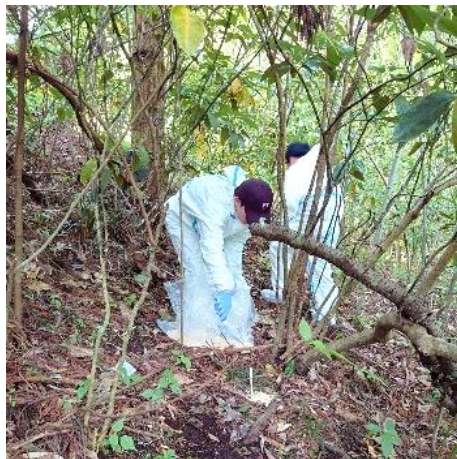
↑ワクチン散布風景