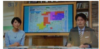
危険度情報に関する報道