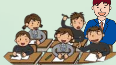
生徒へのアンケート