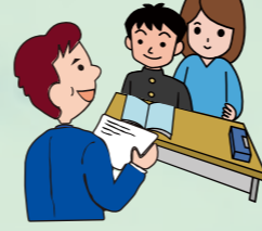
本人・保護者との合意形成