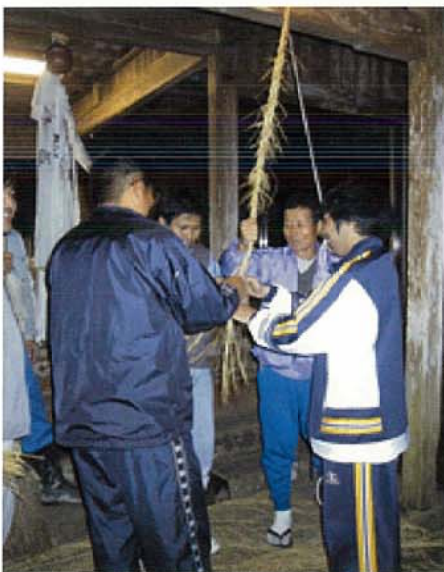
みんなでしめ縄づくり!

にん わかもの あさ がわ はい み きよ ひる それぞれ しごと がっこう 4人の若者が、朝は川に入って身を清め、昼はそれぞれ仕事をしたり学校 に行ったりしたあと、夜になると神社に集まって、新しいしめ縄を作ったり、 獅子舞を舞う練習をしたりして過ごし、そのままそこで寝泊まりします。