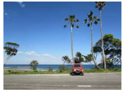
景観を阻害する樹木の伐採（日向市）