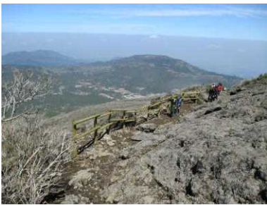
国立公園内ビューポイントの整備（韓国岳）