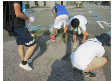
道路愛護デー（宮崎市）