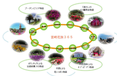
ガーデンツーリズム 計画認定