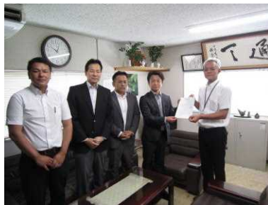
景観形成促進機構 指定伝達式