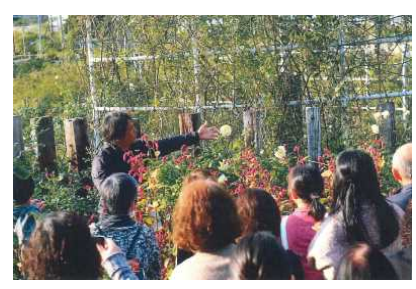
景観形成活動（パラ園での講習会）