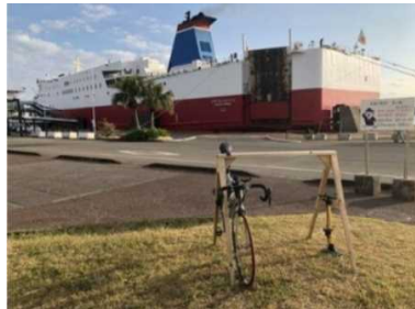
サイクルスタンドの設置（宮崎市）