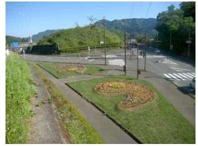
沿道修景による花壇のリニューアル（高千穂町）