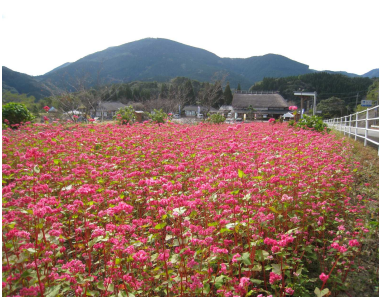
景観の磨き上げ（日南市）