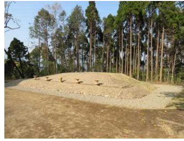
古墳の整備（西都原古墳群）