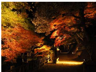
観光地の景観の磨き上げ（三股町）