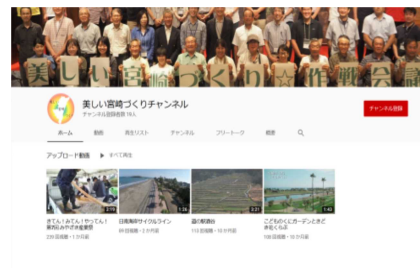
美しい宮崎づくり YouTube チャンネル