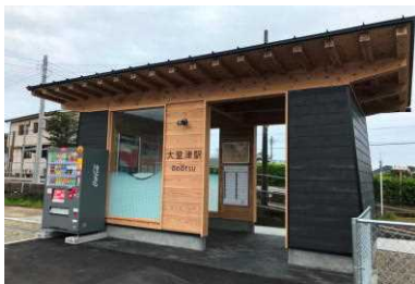
公的スペース等の木質化（大堂津駅）