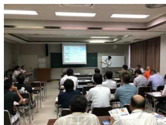
景観に関する出前講座（串間市）