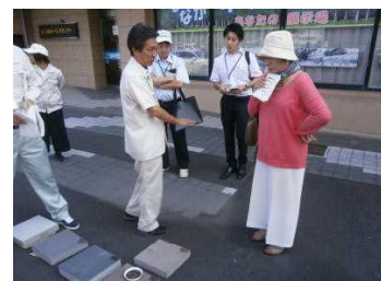
景観まちづくりアドバイザー（色彩）