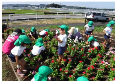
観光地等へのアクセス道路の沿道修景（西都市）