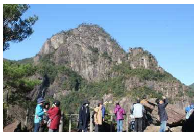
ユネスコエコパークモニターツアー