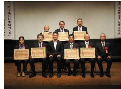
美しい宮崎づくり知事表彰