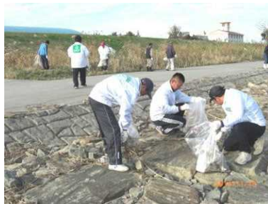
クリーンアップ宮崎