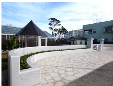
景観に配慮した公共事業（宮交ボタニックガーデン）