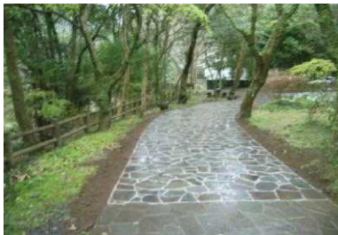
遊歩道の整備（高千穂町）