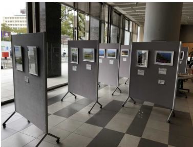
風景写真展（宮崎市）