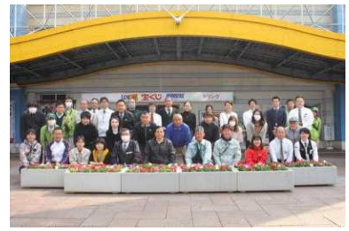
宮崎駅における植栽活動