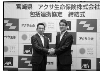
【アクサ生命保険㈱との連携協定 締結式】