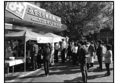
【KONNEでの販売活動の様子】

みやざき物産館KONNEにおいて、中学生や高校生が職場体験を行ったり、高校生が商品の販売活動を行うことにより、勤労観や職業観を育む機会を提供する。