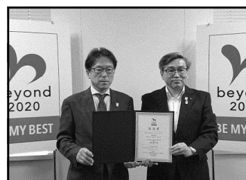
【内閣官房での認証式】

内閣官房東京オリンピック・パラリンピック推進本部に認証された「2020年度の体カテストに向けて、公立学校の全児童生徒が、個人の目標値を設定し、体力向上を目指す取組」を各学校で実施する。