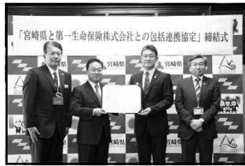
【第一生命保険㈱との連携協定 締結式】

㊦包括連携協定に基づく県産品の販売促進等による地域の活性化や県政情報の発信等による県民サービスの向上等（総合政策課）