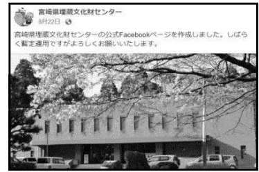
【埋蔵文化財センターフェイスブックページ】