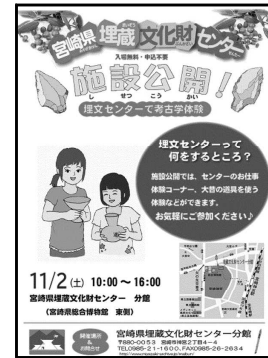
【埋蔵文化財センター施設公開のお知らせ】

県民を対象に、埋蔵文化財センターの施設や作業の様子を公開し、考古学体験を実施する。