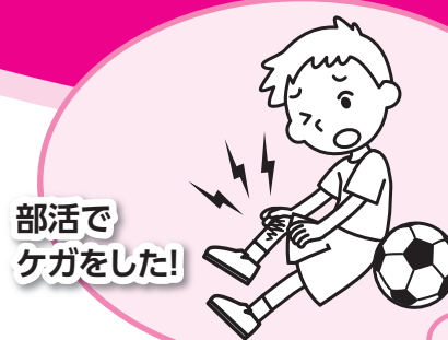
部活でケガをした!