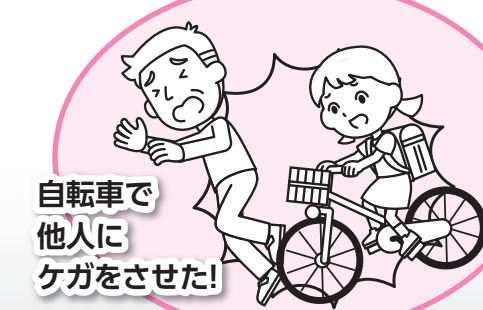
自転車で他人にケガをさせた!