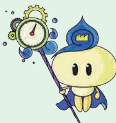
工業用水道事業イメージキャラクター こうすいくん