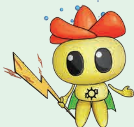
電気事業イメージキャラクター けんでんくん

http://www.youtube.com/user/MiyazakiKigyokyoku/