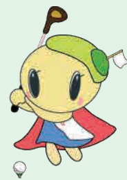
地域振興事業イメージキャラクター ひとつせちゃん