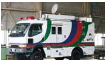
えいぞうそうしんしゃ 映像送信車