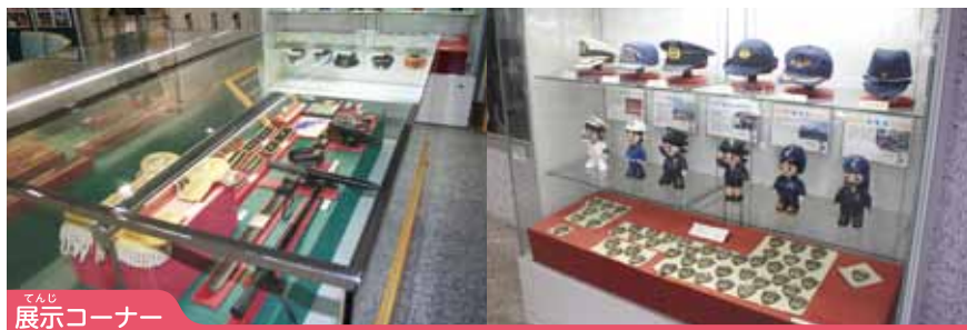
てんじ 展示コーナー