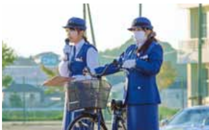
こうつう あんぜん きょうしつ 交通安全教室