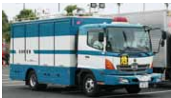
レスキュー車 しゃ