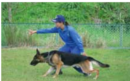
けいさつけん 警察犬