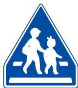
おうだんほどろ 横断歩道