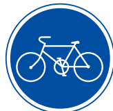
じてんしゃせんよう 自転車専用