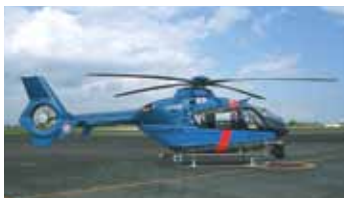
ヘリコプター(ひむか)