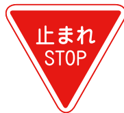
いちじていし 一時停止