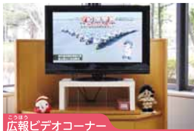
こうほう 広報ビデオコーナー

よい子の皆さんに宮崎県警察のしくみや活動のようすを紹介する「警察広報コーナー」を設置しています。広報コーナーでは、警察の活動を上映するビデオを備えており、皆さんと警察のふれあいの場として、あるいはがくしゅうの場として親まれています。