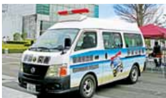
いどう こうばんしゃ 移動交番車