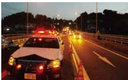
こうつうとりしま 交通取締り