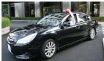
そうさようしゃ 捜査用車