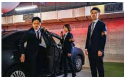
けいじ きこ そうさ は こ そうさ 刑事の聞き込み捜査、張り込み捜査など

ちしき ぎじゆつ つか じけん かいけつ いろいろな知識や技術を使って事件を解決しています。