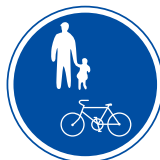
じてんしゃ ほこうしゃせんよう 自転車および歩行者専用