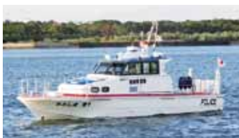
せんぱく 船舶(あおしま)