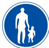
ほこうしゃせんよう 歩行者専用