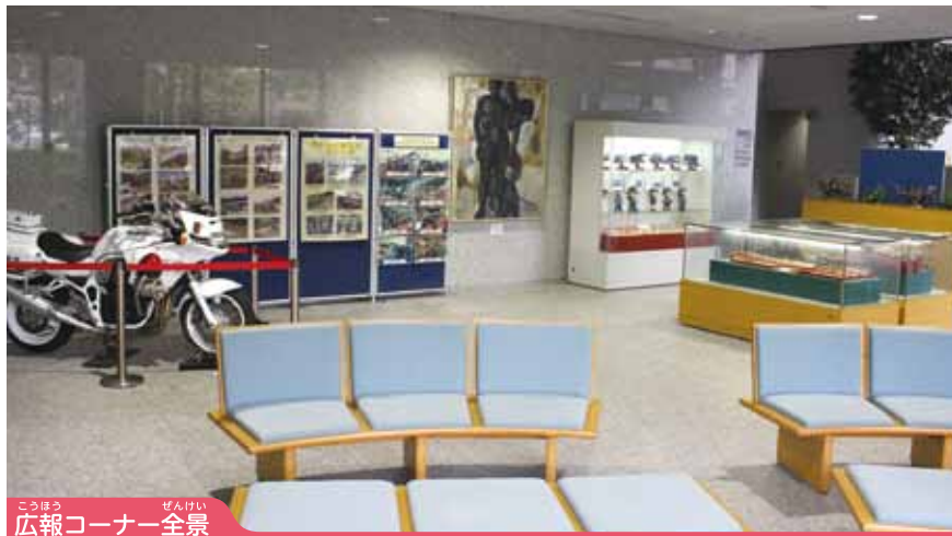
こうほう ぜんけい 広報コーナー 全景