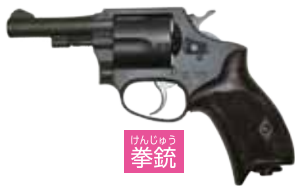
けんじりょう 拳銃