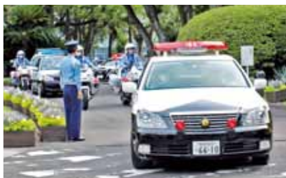
パトカーと白バイの活動