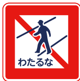
ほこうしゃおうだんさんし 歩行者横断禁止