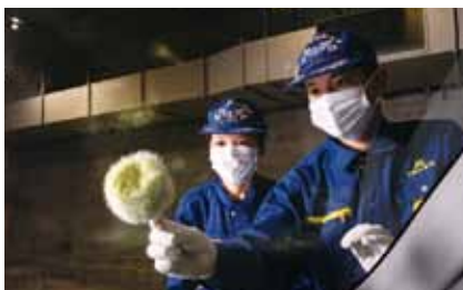
かんしきかつどう 鑑識活動