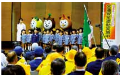
こうつうあんぜんうんどう 交通安全運動

こうつうじこ あんぜん しゃかい たいさく すす 交通事故のない安全な社会をめざし、さまざまな対策を進めています。