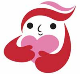
犯罪被害者等支援シンボルマーク ギュっとちゃん