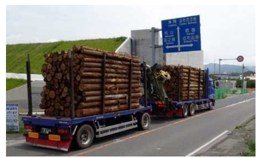
木材運搬状況(県産木材を志布志港へ)