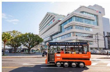
グリーンスローモビリティ (「ぐるっぴー」R2.11.20~運行)