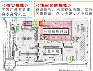
重点道の駅都城 配置図