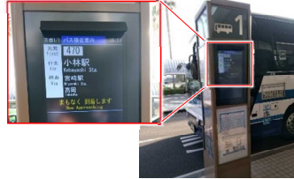
路線バス接近の案内(バスロケ)