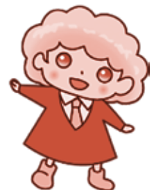
パートタイム・有期雇用労働法 キャラクター「パゆう」ちゃん