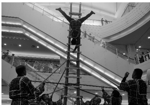
とびのはしご乗り

本イベントは技能士の優れた作品の展示、熟練技能士の実演やものづくり体験（技能体験）などを通して、ものづくりの大切さ・おもしろさ・重要性を伝えるために開催されています。