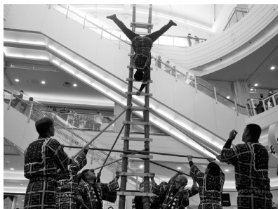
とびのはしご乗り

イオンモール宮崎にて10/24(土)、25(日)の2日間に渡って開催されました。