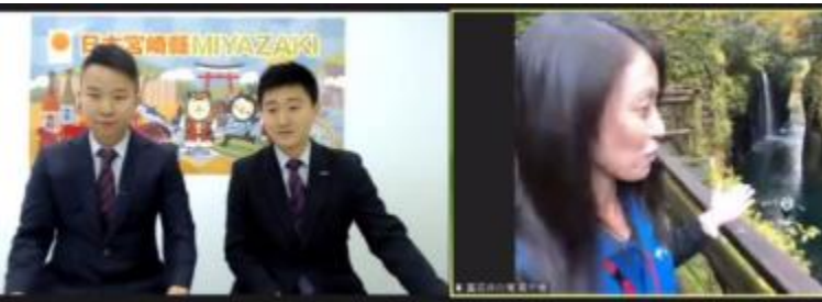
オンライン宮崎ライブツアー（高千穂）の様子