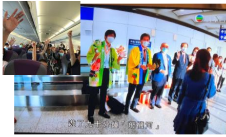
フライケーション後のお見送り