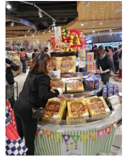
「Karada Good」をテーマにPRする売り場