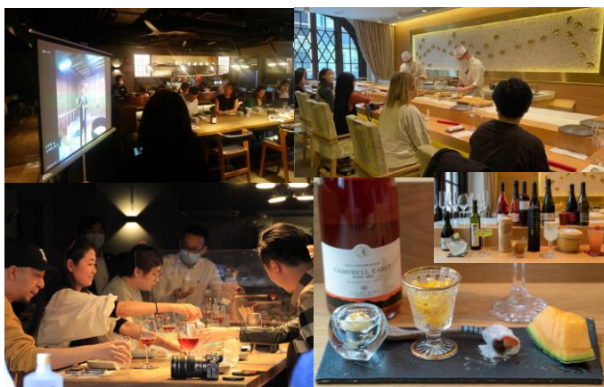
宮崎の酒メーカーズディナーと銘打ち、ペアリングの魅力も発信

県産酒の販路拡大とファンづくりを目的に、県産酒が製造される環境や歴史、製造方法などのストーリーや味・香りなどの特徴を伝えるイベントをNOJO・SUSHIZO・GISHIKIの3店舗で開催しました。オンラインを通じて、醸造家や蔵元が直接、香港のレストランシェフやスタッフ、バーテンダーに対して、酒の紹介や県産食材を使った料理とのペアリングなどの魅力を発信し、大変好評でした。レストラン関係者は、フルーツの香りや飲み口の柔らかいビールやワインに興味があり、Bar関係者は、製造工程や特徴ある香りやコクのある飲み口の焼酎に興味を持つといった特徴がありました。出席者からは早速商談やサンプル提供依頼があったことから今後の展開が期待されます。