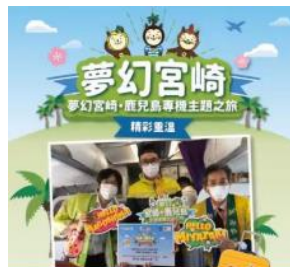
多くのメディアで報道

訪日旅行取扱実績No1のEGL Toursと連携し、オンライン宮崎ライブツアーと香港上空フライケーション南九州遊覧の旅を実施しました。同社も初めての取組となるオンラインツアーでは、同社の進行ガイドと青島や高千穂など主要観光地の現地ガイドが掛け合いをしながら、その魅力を紹介するスタイルにしました。ライブのため失敗できない緊張感はありましたが、入念な打合せやリハーサルを行うことで大成功のうちに終わることができました。その二日後には、同社がチャーターした航空機で香港上空を飛行するフライケーションの企画と連携した観光PRに取り組みました。「南九州遊覧の旅」と銘打ち、機内に搭乗して、宮崎の紹介やクイズゲームをしたり、観光パンフ・土産配布などを行い、宮崎の魅力をPRしました。大きな情報発信力を持つ同社との連携により、テレビ・新聞をはじめ、同社の多くのフォロワーに対し、宮崎の魅力を最大限露出することができました。