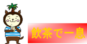
宮崎の食や観光など多くの魅力をアピールできた2週間でした！

青果物や加工品、飲料や冷凍品などの約100アイテムの販売促進を行ったほか、旗艦店2店舗では、宮崎料理のレシピを料理講師が調理しながら紹介するDemo Kitchenを実施するなどを行い、多くの消費者で賑わいました。また、Kornhill店では、観光情報PRコーナーを設置し、観光パンフやノベルティの配布、PR動画の配信などにより、宮崎観光情報を、直接消費者に対し提供しました。宮崎の物産やグルメ、観光・文化等の宮崎の総合的な魅力を発信することができました。