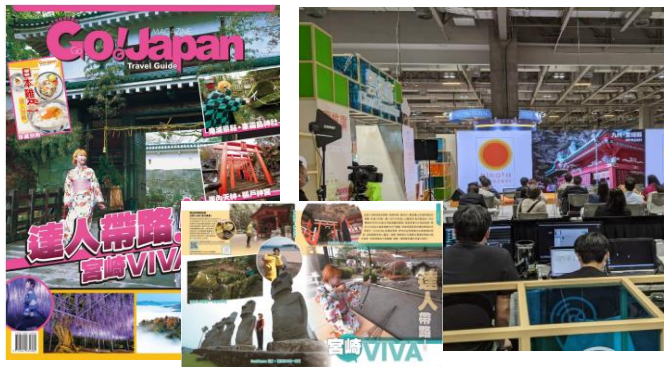
メディア活用し魅力発信