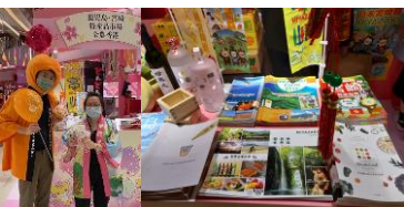
売り場を盛り上げつつ観光パンフレットを配布

香港では老若男女問わずキャラクターが人気です。特にサンリオのキャラクターは様々な商品とコラボしており、いずれも高い知名度と人気を誇っています。今回、年間を通じて最も消費意欲が高まる春節商戦期にショッピングモール「Nina Mall」でサンリオが実施する「リトルツインスターズ春祭り2022」に出展し、県産品の販売と観光プロモーションを行いました。実施にあたり、全農国際香港有限公司と鹿児島県とタッグを組み、県内10企業23商品の加工品や工芸品を販売した他、温室きんかんなどの旬の果物を販売しました。年明けから新型コロナの域内感染が広がり、イベント前日になって展示目玉のオブジェが政府指示により撤去されてしまうなど、逆風の環境でしたが、春節の小分けニーズを捉えたギフトセットを彩りよくならべ、来場客の関心と呼ぶことができました。また、売り場を使ってモールのCM撮影もあり、県の名前をPRすることもできました。