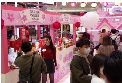
メディア取材ではモールのCMも撮影