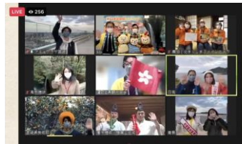
ウェビナースタジオの模様