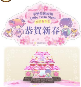
新春でピンク主体にイベント造作物が準備された