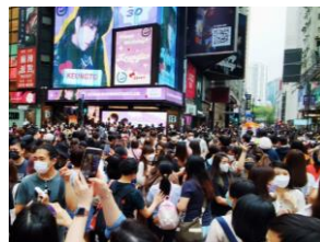
姜涛誕生日をファンがお祝い

香港では1～3月にコロナの域内感染が激増し、夕方6時以降の店内飲食が禁止となるなど、観光以外の産業も大きな打撃を受けました。感染が収まった4月からは4/20に夜間飲食、5/21にバーの営業がそれぞれ解禁となり、消費意欲がV字回復しています。最近、スシローと並び人気なのが、ドンキの寿司屋「鮮選寿司」。常に行列が絶えません。イベント熱も再燃し、アイドルグループMirrorのセンター姜涛の誕生日には、ファンが香港の路面電車を1日無料にするなど数々の祝賀活動を行い、人気の高さを見せつけました。