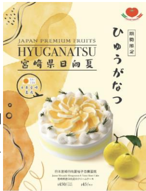
日向夏のクリームケーキ 450HKD/ホール 45HKD/カット