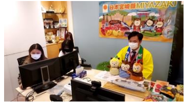
スタジオ (EGL Tours本社) の模様