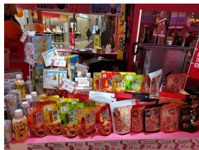
香港の食品表示規制をクリアした商品が並んだ加工品売り場

香港では老若男女問わずキャラクターが人気です。特にサンリオのキャラクターは様々な商品とコラボしており、いずれも高い知名度と人気を誇っています。今回、年間を通じて最も消費意欲が高まる春節商戦期にショッピングモール「Nina Mall」でサンリオが実施する「リトルツインスターズ春祭り2022」に出展し、県産品の販売と観光プロモーションを行いました。実施にあたり、全農国際香港有限公司と鹿児島県とタッグを組み、県内10企業23商品の加工品や工芸品を販売した他、温室きんかんなどの旬の果物を販売しました。年明けから新型コロナの域内感染が広がり、イベント前日になって展示目玉のオブジェが政府指示により撤去されてしまうなど、逆風の環境でしたが、春節の小分けニーズを捉えたギフトセットを彩りよくならべ、来場客の関心と呼ぶことができました。また、売り場を使ってモールのCM撮影もあり、県の名前をPRすることもできました。