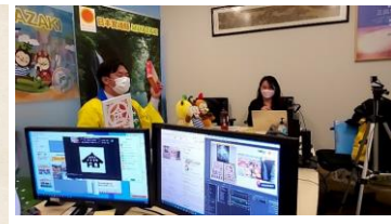
参加・ゲーム等の景品紹介