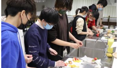
学生のきんかん調理の様様