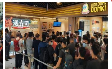
ドンキの寿司屋「鮮選寿司」