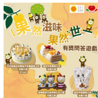
SNSキャンペーンを実施 コメント・シェアとも多く好評