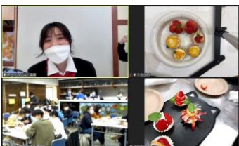
講師の調理指導、学生作品