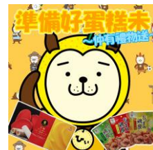
期待感を持たせるため事務所より予告発信