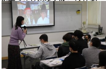
学生のセミナー参加・視聴の様様