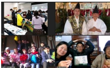
農泊・伝統文化紹介団体の面々