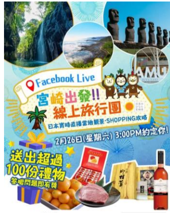
EGL Tours 東瀛遊 旅行代理店 EGL ToursのFacebook Live広告

長引くコロナ禍により訪日旅行ができない状況が続く中、宮崎の認知度や好感度の維持・向上やコロナ終束後の宮崎旅行の商品造成、誘客促進を図るため、日本送客実績No1の旅行会社EGL Toursと連携した宮崎PRオンラインツアーを実施しました。同社ツアーガイドを進行役に、宮崎の現地ガイドとともに、観光スポットの紹介や体験コンテンツの案内、ショッピング・グルメの情報提供などにより、宮崎の多彩な魅力をアピールしました。ツアーの中では、軽快でライブ感溢れる展開の中で、農泊やきんかん収穫、神楽などの体験観光を紹介したり、特産品が当たるゲームコーナーを盛り込むなど、視聴者の興味・関心を高める演出に工夫を凝らせた結果、視聴者数や閲覧件数、コメント数などとても良好な実績・成果を得ることができ、5月27日にはテレビ東京のWBS(ワールドビジネスサテライト)に取り上げられました。視聴者からは「コロナ終息後には宮崎に旅行したい」との声を多くいただいたほか、EGL Toursからもプログラム内容に関心や評価をいただくなど、誘客コンテンツとして大きな可能性を感じました。