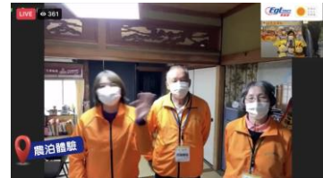
現地ガイドによる農泊紹介