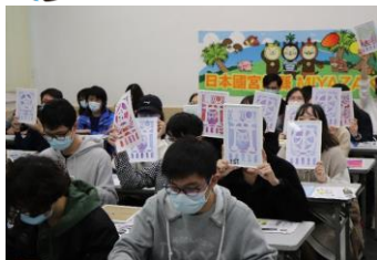
教室での神楽彫り物づくり体験