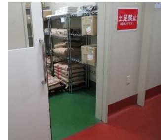
床のゾーニング(色分け)