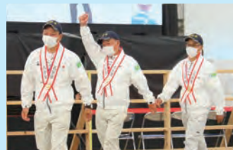
4大会連続となる内閣総理大臣賞を受賞

この絶好の機会をしっかりと捉え、国内外に宮崎牛をはじめとする本県の魅力をアピールし、コロナ禍や物価高騰により影響を受けた暮らしや地域経済の回復を図り、宮崎再生に結びつけてまいります。