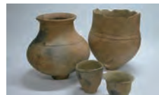
弥生土器(穂遺跡/宮崎市)