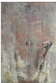
チェッコ・ボナノッテ「連続」