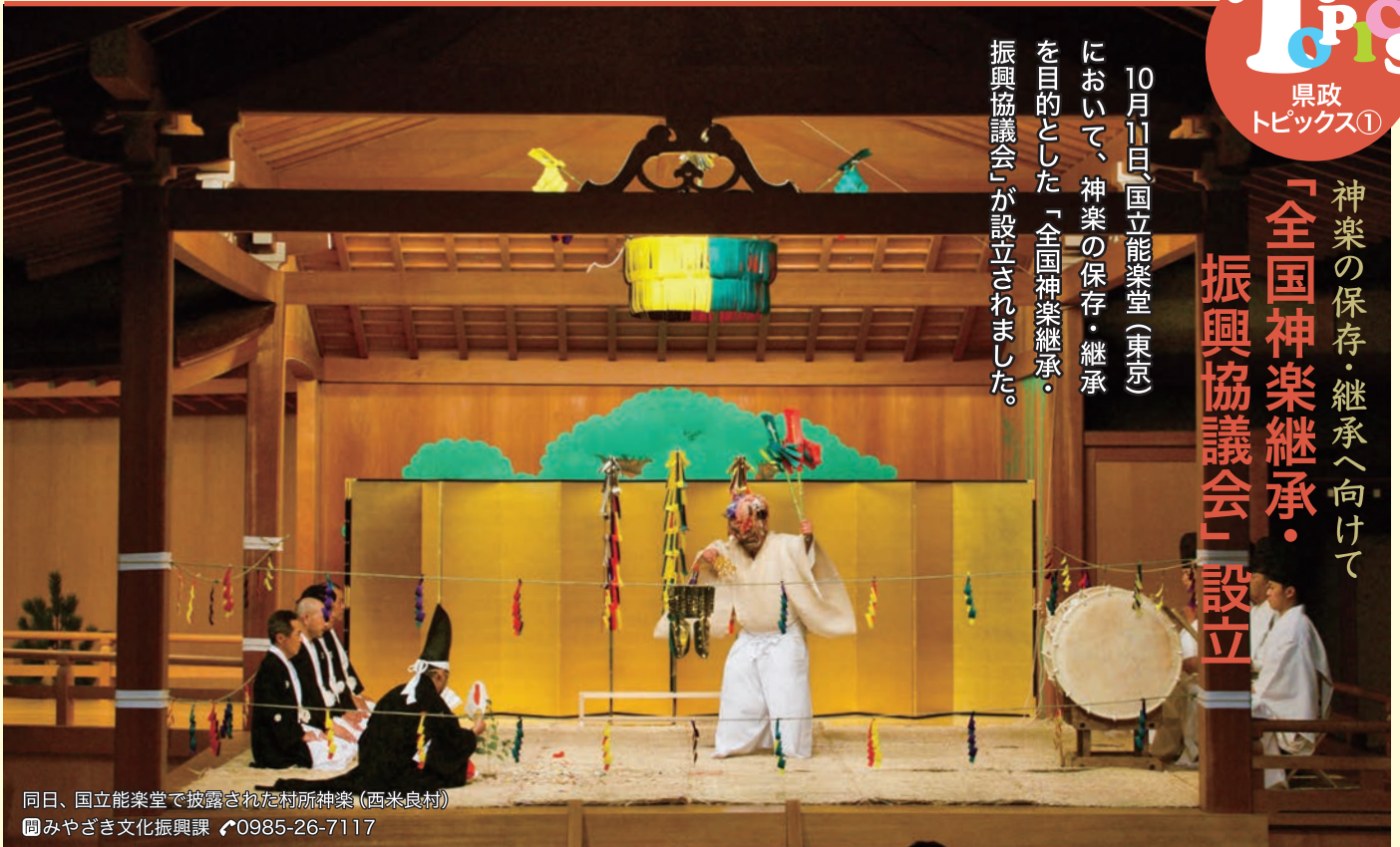
同日、国立能楽堂で披露された村所神楽（西米良村）