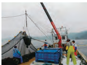
定置網(延岡市北浦町)