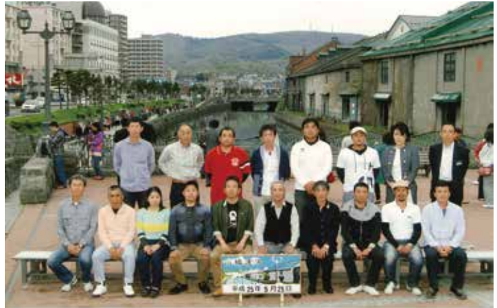
宮前建設株式会社 北海道旅行

宮崎県内を中心に、主に港湾工事、舗装工事を長年手がけています。社員同士が仲が良いので和気あいあいとした職場です。働き方改革により会社の年間休日が増え、有給休暇を取得しやすい環境になっているので趣味や家族サービスの時間が増えました。ワークライフバランスが実現できる会社です。