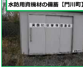
水防用資機材の備蓄【門川町】