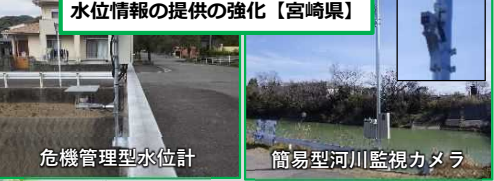
危機管理型水位計