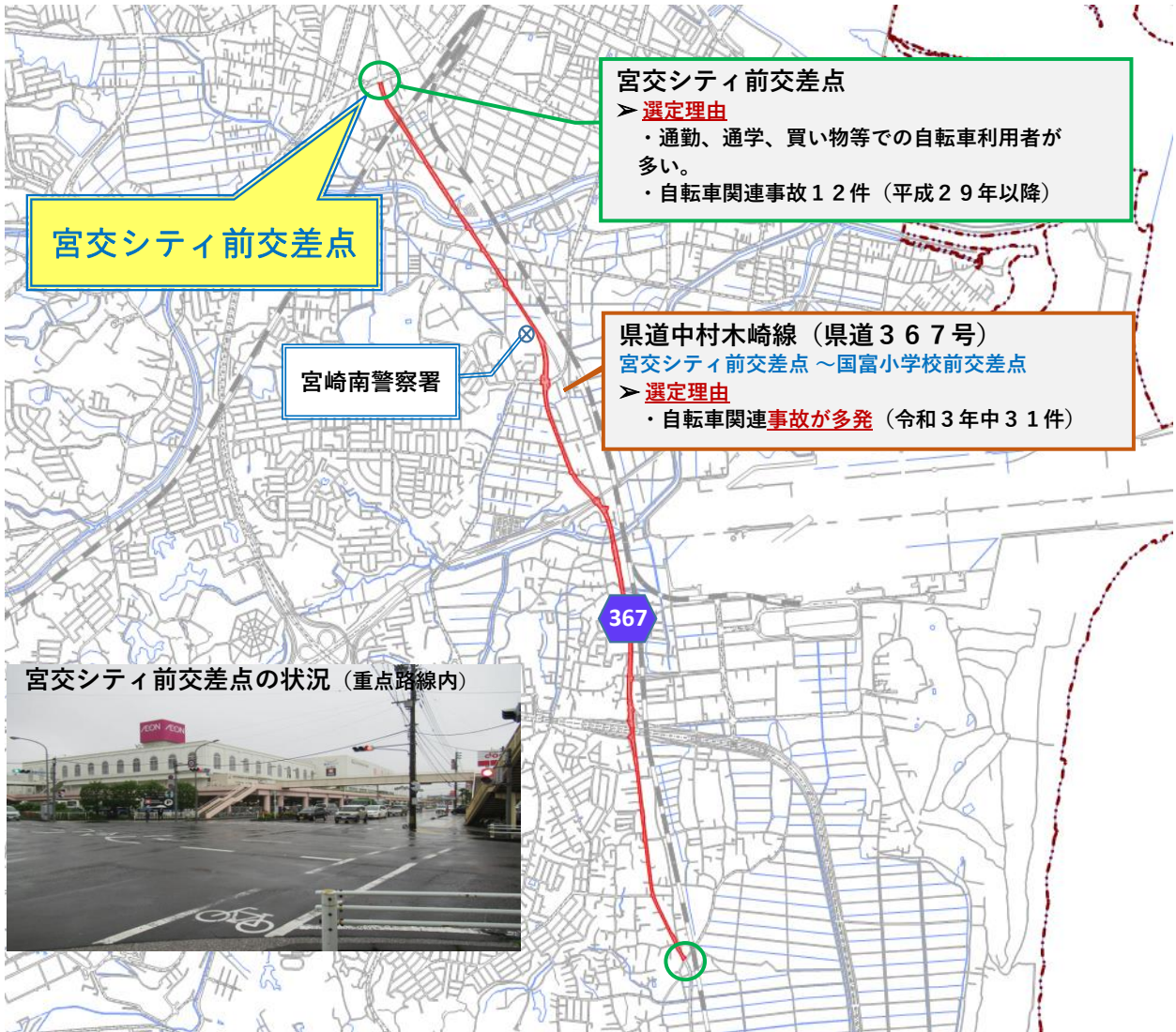
宮崎南警察署の自転車事故の発生状況