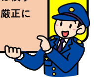
自転車が関係する交通事故の発生状況 (重点路線内)

警察では、自転車運転者の信号無視等に対し、指導警告を行うとともに、悪質・危険な交通違反に対しては検挙措置を講ずるなど、厳正に対処しています。